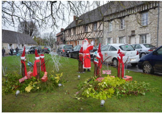
Le Père Noël au pays des lutins