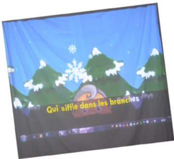
Les petits choristes de Noël