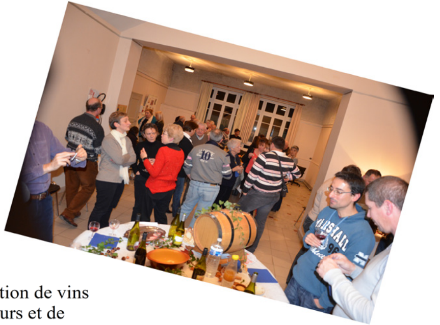
Dégustation de vins primeurs et de charcuteries entre amis