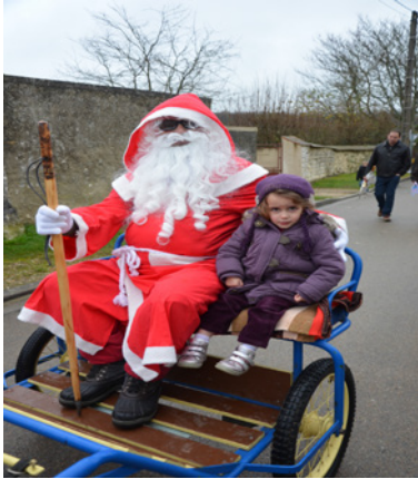
Ballade en calèche avec le Père Noël