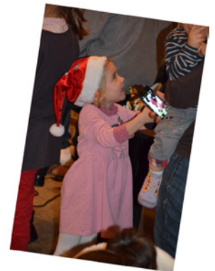
La joie de nos petits Lutins pour la distribution des cadeaux