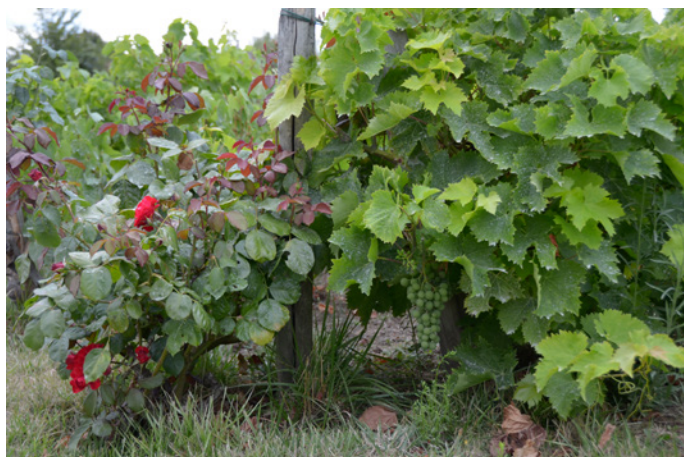
2015 - La vigne à Tacoignières

Plusieurs anciens de Montchauvet se souviennent d'y avoir fait les vendanges et participé à la fabrication du vin.