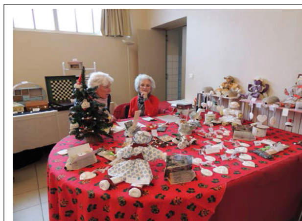
LE STAND des AMIS de MONTCHAUVET