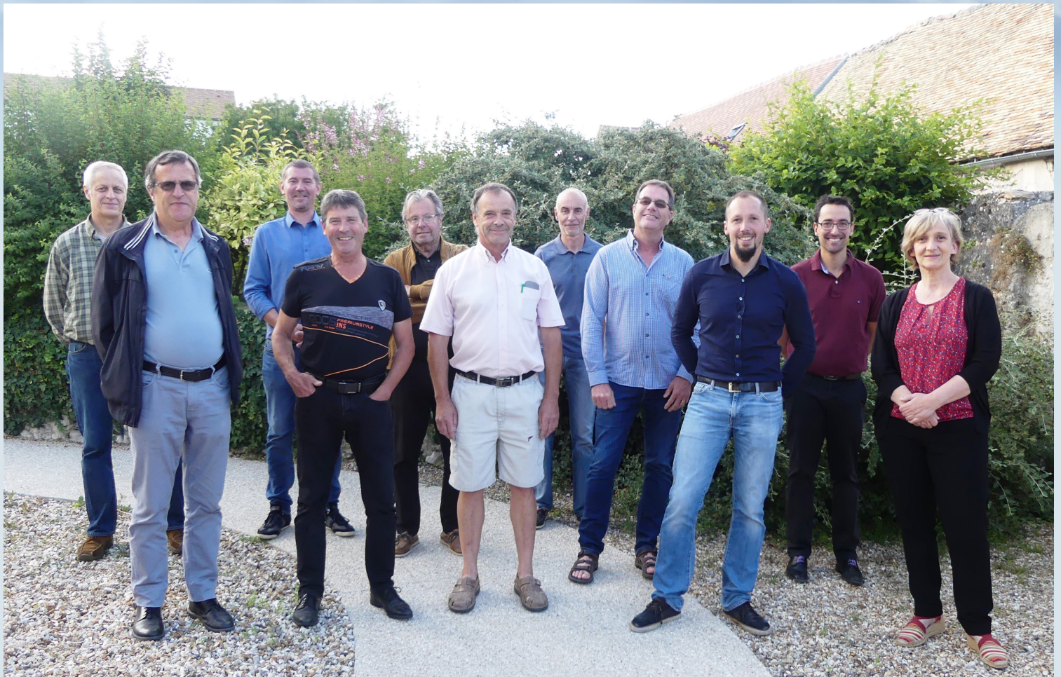
Le Conseil Municipal. De gauche à droite :