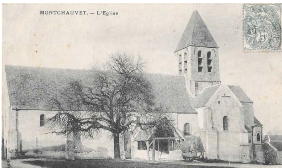
Carte postale de l'église au début du XXe siècle, avant la reconstruction du clocher et la ruine de la nef