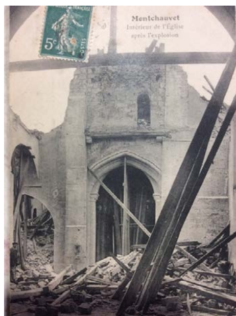
La nef après l'écroulement du clocher.