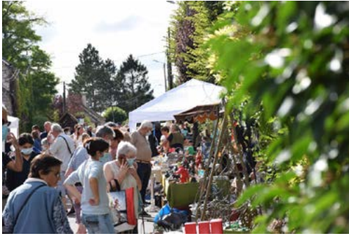
Brocante Marché Gourmand 12 Septembre 2021