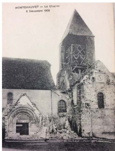
Etat du clocher en 1909

Merci à madame Mouillard pour son aide précieuse.