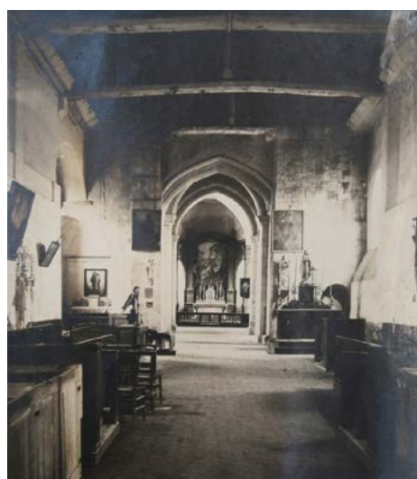
Intérieur de l'église avant la destruction du clocher